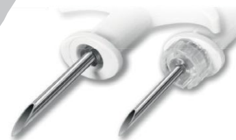
Aguja T-IP 2,6 mm